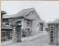
創立当時の福原学園正門