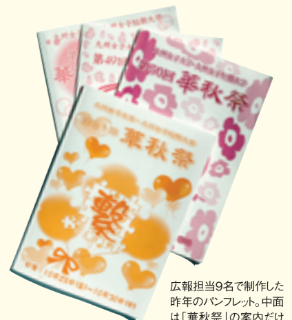
広報担当9名で制作した 昨年のパンフレット。中面 は「華秋祭」の案内だけ でなく、広告も多数掲載。

実社会で即戦力となりそうな勢いの行動力である。 結束力が生む達成感。 地域社会との交流も 成長の糧となる。