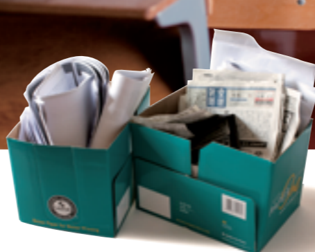
研究室には、新聞などの切り抜きがぎっしりと入った箱がいくつも積み重ねられている。古い経済の話と現在を結びつける資料として授業で使用される。

「世の中は常に変化していき、新しい見方とされていくことも、どんどん古くなつていきます。まずはそのこと