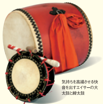
気持ちを高揚させる快音を出すエイサーの大太鼓と締太鼓

観るものの心を震わす沖縄県人会のエイサーは、練習の賜物である。さらに、演舞の完成度を高めているのが「自分たちの舞台で初めてエイサーを観る人は、それが沖縄のエイサーだと思って観る。しっかりと踊らなければエイサーを間違った形で伝えることになる」という責任があります。この気持ちで、舞台に立つ彼らを「層輝かせているに違いない」。エイサーのクライマックスは観衆を巻き込んだ「カチャーシー（手踊り）」である。彼らのライブでは、ぜひとも参加して、沖縄の伝統芸能の素晴らしさを共有してほしい。