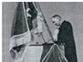
1957 福原学園創立10周年記念式典