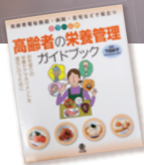
現場で役立つ「管理栄養士技術ガイド、高齢者の栄養管理ガイドブック」を共同出版。

所属は家政学部 栄養学科講師。担当科目は給食管理、給食経営論、給食管理実習、フードサービス論、臨地実習I、管理栄養士総合演習I他。貴重な4年間が充実した時間になるように、一緒にチャレンジしていきたい。趣味はフレイバーティー。いろいろな香りの紅茶にはまっている。特技は整理整頓。限られたスペースを片付けるのは得意。