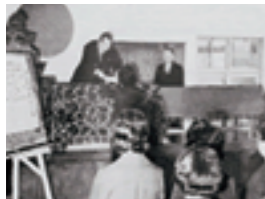
1962 第1回卒業式(九州女子短期大学)