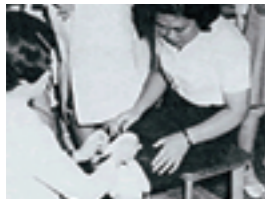
1968 養護教育科のホウタイ実習