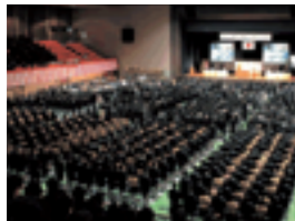
2007 福原学園創立60周年記念式典