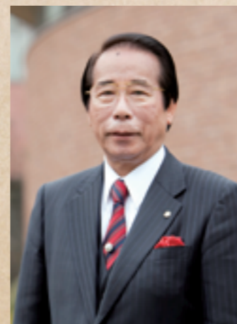
学校法人福原学園 理事長