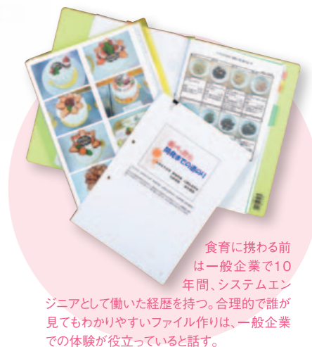
食育に携わる前は一般企業で10年間、システムエンジニアとして働いた経験を持つ。合理的で誰が見てもわかりやすいファイル作りは、一般企業での体験が役立っていると話す。

この体験は社会人としての力を高め、強くしなやかな九女なでしことして羽ばたく糧になる。その思いに揺るぎはない。