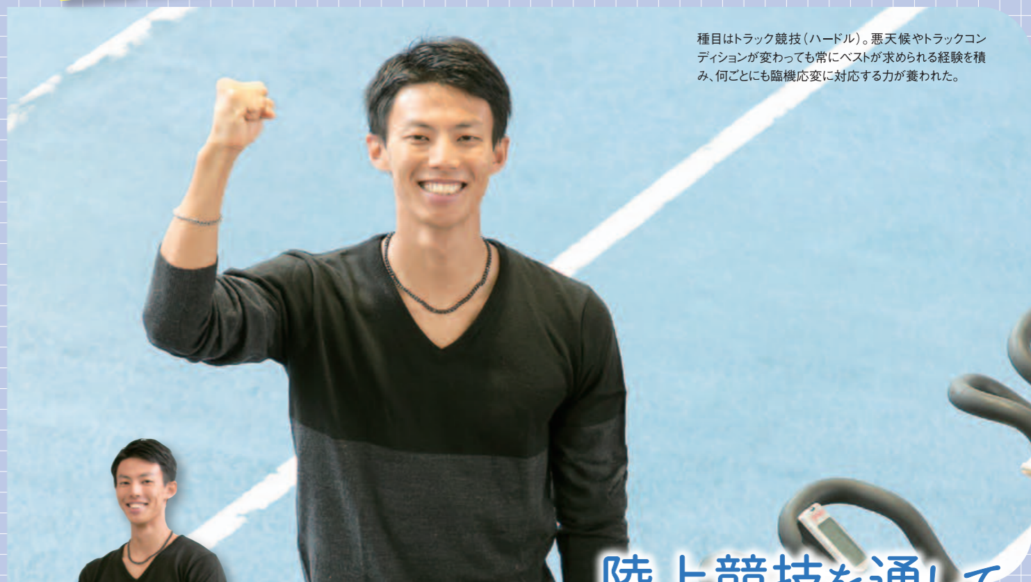
種目はトラック競技(ハードル)。悪天候やトラックコンディションが変わっても常にベストが求められる経験を積み、何ごとにも臨機応変に対応する力が養われた。

「職種を絞らないまま、気になる企業にできるだけたくさんアプローチしたため、スケジューリングが大変でした」。就職活動がピークとなる夏はバドミントン部の大会と沖縄での選考試験が重なるなど精神的にも追い詰められ、就職活動対象の企業の見極めに時間がかかりすぎたと悔やんだ。