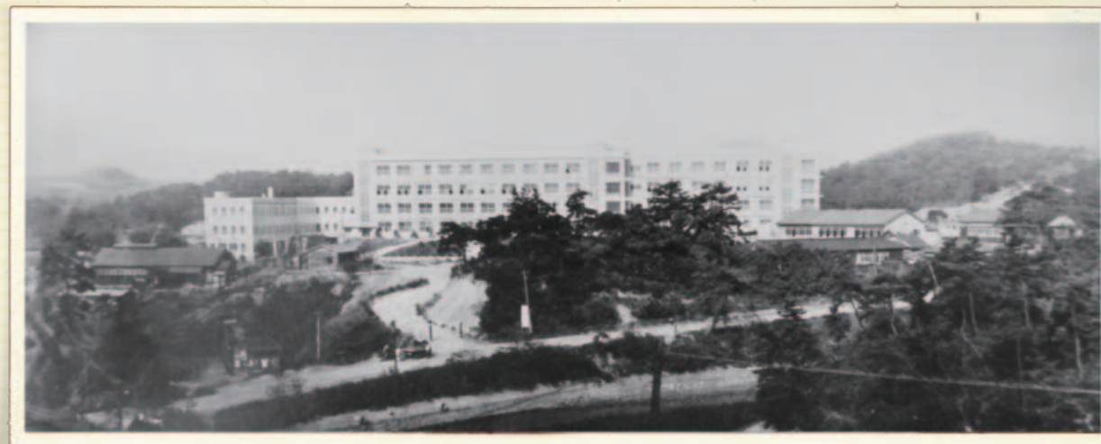
昭和35年頃の学園全景。正面が本館、その右は増築した部分。北東を向いて建つ左の建物が桃園館。増築し本館との間がつながれている。